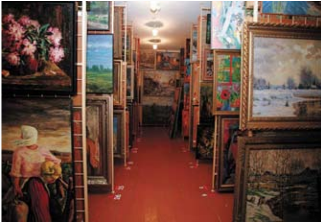
Het depot van het Tukums Museum te Tukums (Letland)

Letse kunstenaars die evenals leden van de Ploeg in de jaren twintig en dertig van de vorige eeuw sterk werden geïnspireerd door het expressionisme van Die Brücke.